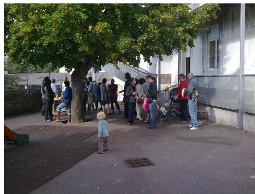
Une cour bien animée

Les enfants s'en sont donnés à cœur joie et les parents ont pu apprécier la cour des maternelles sous le soleil.